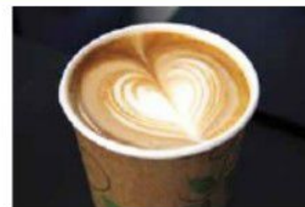
Caffista voi ostaa myös kahvijuomia mukaan.